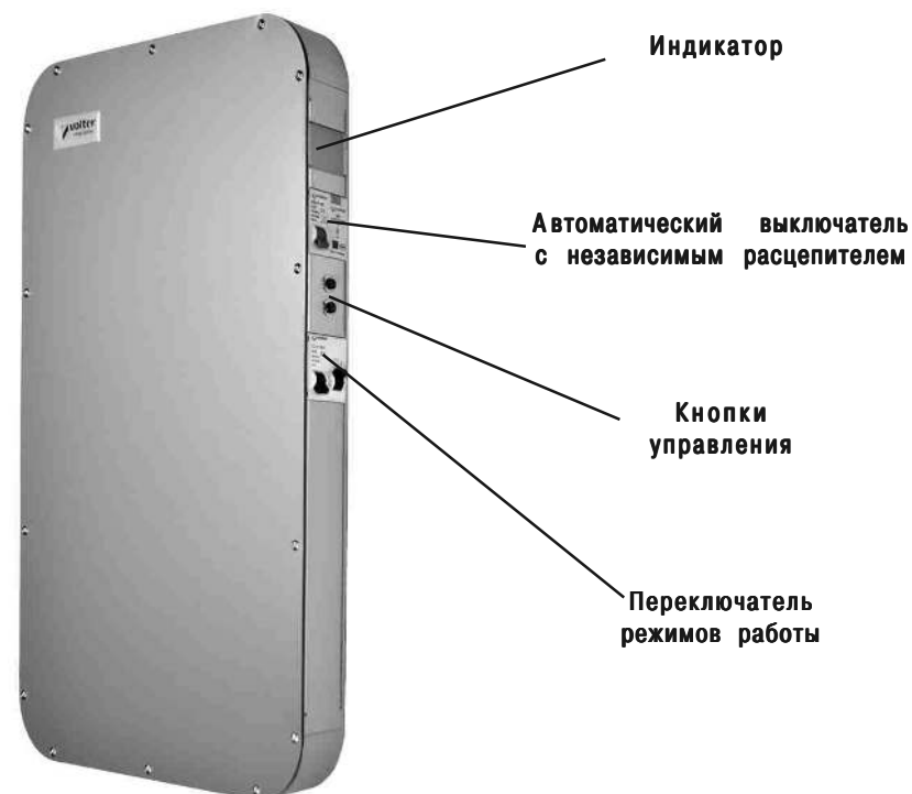
Рис. 1а. Стабилизатор напряжения Smart-4, Smart-5, Smart-7.

Жидкокристаллический индикатор показывает уровень входного и выходного напряжения и нагрузку* в процентах (*кроме моделей Smart-4, Smart-5, Smart-7). На боковой панели стабилизатора расположены автоматический выключатель с независимым расцепителем, переключатель режимов работы «Стабилизация-Транзит» и кнопки управления.