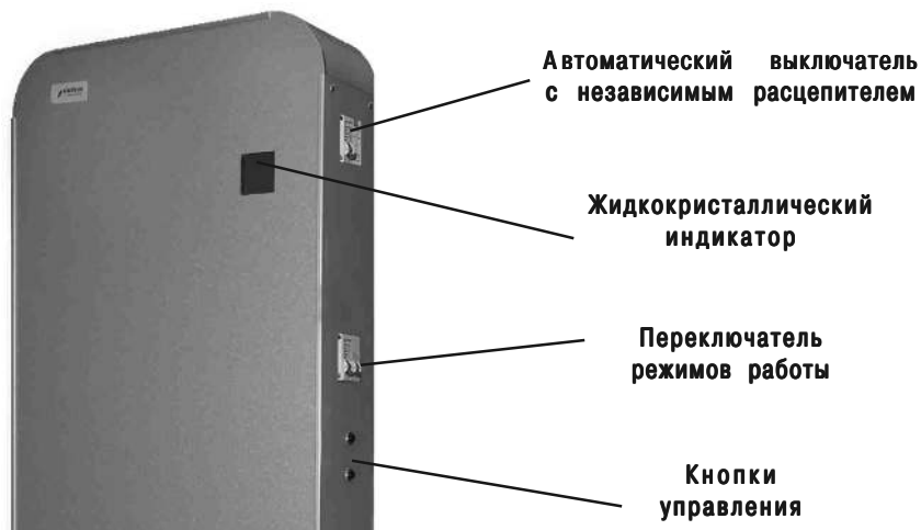
Рис. 1в. Стабилизатор напряжения Smart-18, Smart-22, Smart-27.

В верхней части расположен клеммник, для подключения стабилизатора, закрытый крышкой. Там же расположен заземляющий контакт.