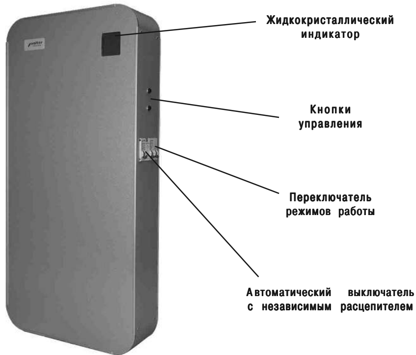
Рис. 16. Стабилизатор напряжения Smart-9, Smart-11, Smart-14.