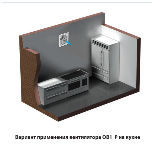
Вариант применения вентилятора ОВ1 Р на кухне