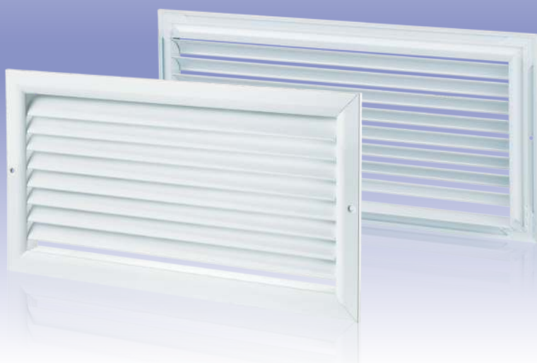
Однорядная горизонтальная вентиляционная решетка с зафиксированными направляющими воздушного потока