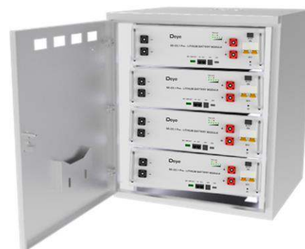
Встановлення в стійку