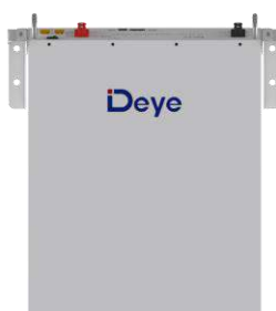
Встановлення на стіну